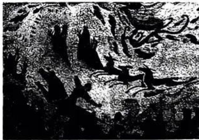
图 1 敦煌莫高窟二四九窟北魏壁画《狩猎图》