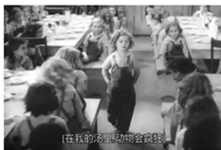
图5 电影《卷头发》剧照