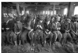
图4 电影《雾都孤儿》剧照

材料二 图4、图5是近现代两部电影中的场景。图4是电影《雾都孤儿》(1922年)剧照,同名小说1838年出版,图片所示为奥利弗等童工在拆麻绳;图5是秀兰·邓波儿主演的电影《卷头发》(1935年)剧照,图片所示为美国孤儿院的午餐时刻。