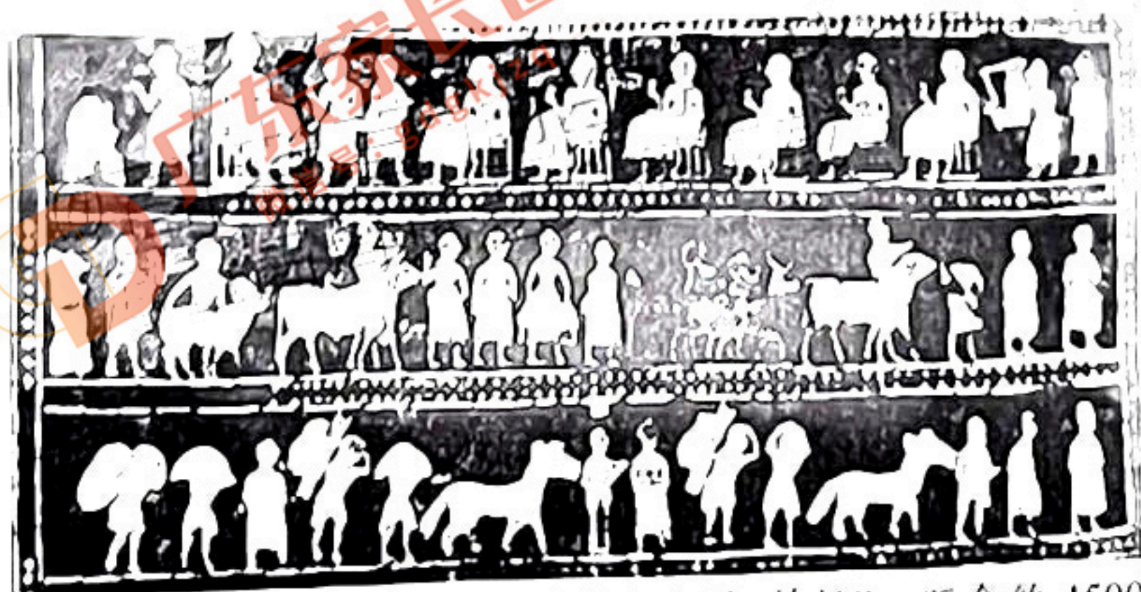
图 5: 一件苏美尔人墓葬出土的“饰板”, 距今约 4500 年。