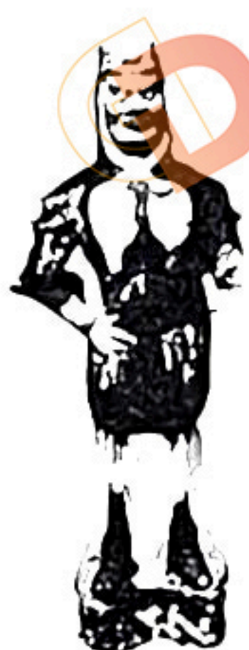
图3：西安出土的唐三彩——戴兽头盔持器物的武士俑。