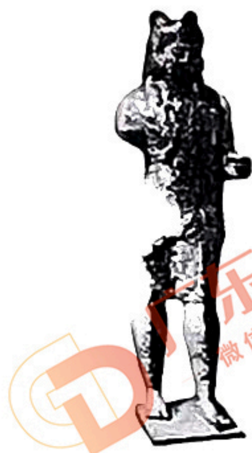
图2：地中海东北岛屿出土的古希腊时期文物——戴狮头盔持棒的赫拉克利斯像。