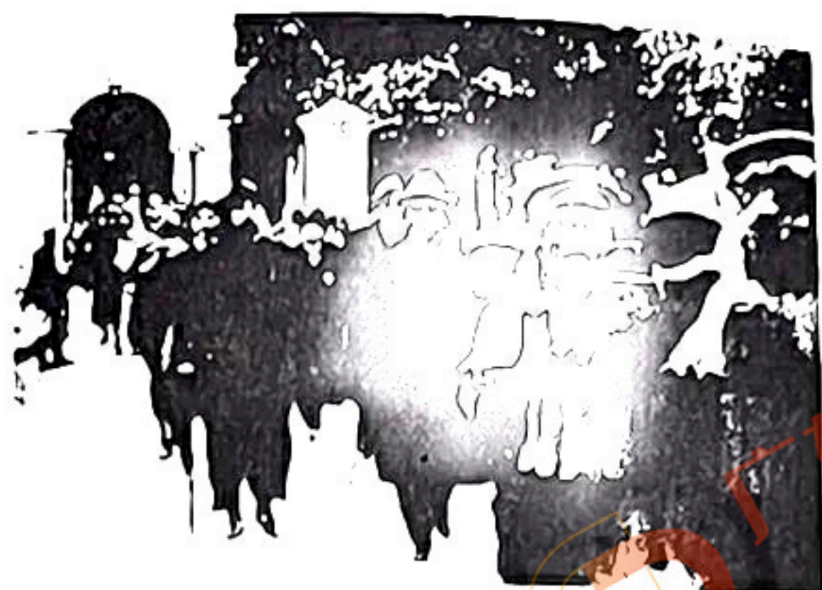
图 4: 李大钊、孙中山从会场走出的照片, 1924 年 1 月摄于广州