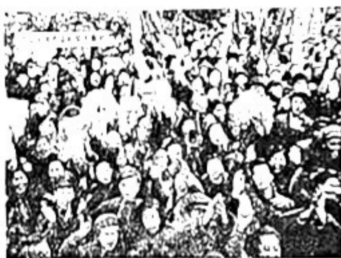
人民欢庆社会主义改造的伟大胜利