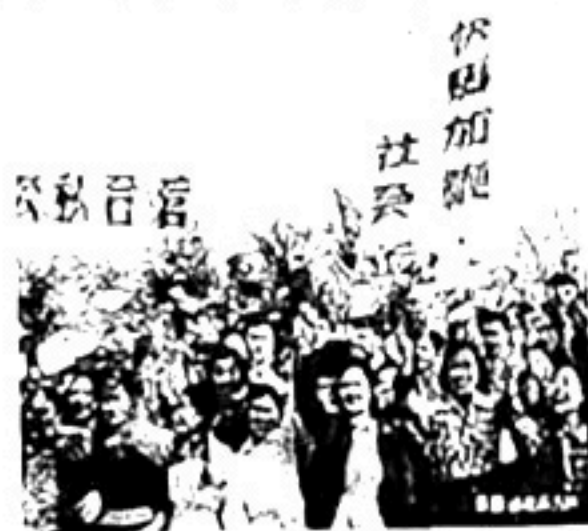
手工业者踊跃报名入社