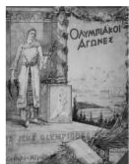
希腊雅典第一届奥运会会徽

每届奥运会都有不同的会徽,但所有会徽都带有五环标志,然后再衬之以反映东道国特点或民族风俗的图案。根据奥林匹克宪章,五环的含义是象征五大洲的团结以及全世界的运动员以公正、公平、坦率的比赛和友好的精神在奥林匹克运动会上相见。