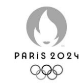
法国巴黎第三十三届奥运会会徽