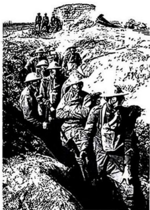
图二 一战中的凡尔登战役

材料三 法德和解是战后特定历史条件和国际形势下的产物，是二战后西欧乃至世界政治格局中具有深远影响的事件，同时也是法德两国主观上共同努力的结果，它的发生既有深远的历史意义，也有广泛的现实意义，两国政治上的和解和经济上的合作，去掉了防范对方的后顾之忧，促进了两国经济的发展。1951年，西欧6国建立煤钢共同体，1957年通过了旨在建立欧洲经济共同体和原子能共同体的协议。1967年，三个共同体合并为欧洲共同体，使世界为之瞩目，成为世界格局中不可忽视的力量。实现这一切，法德和解及合作是“不可替代的发动机”。