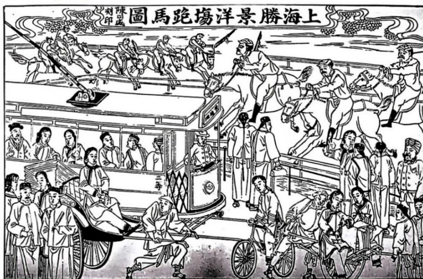
《上海胜景洋场跑马图》

上图是清末苏州桃花坞年画名店陈同盛画店出品的风俗年画。从图片中提取信息并结合近代史有关知识，提出一个明确的看法并进行阐述。(要求：看法合理，史论结合，逻辑清楚)