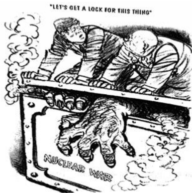
让我们为这东西加把锁(漫画)

——Cuban Missile Crisis[EB/OL].: wikipedia, 2018-3-31.(1962年11月美国漫画家Herblock 发表于华盛顿邮报)