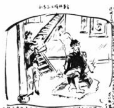
图二 川滇边干人之家