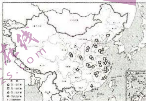
魏晋至隋唐时期墓葬出土耳杯分布变化图

(注：第一期为曹魏到西晋早期，第二期为西晋中晚期，第三期为东晋时期，第四期为南北朝到隋唐时期。)