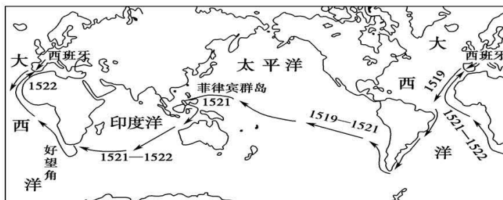
图三 麦哲伦环球航行路线示意图