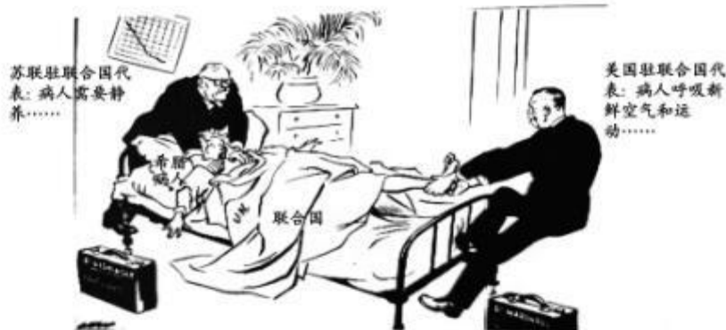
[新西兰]大卫·洛，漫画《当医生有分歧时》，1947年9月17日