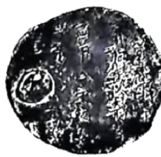
③ 唐朝怀集唐调银饼