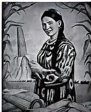
图4 《看,我们社里增加的财宝》(1957年)

根据材料并结合所学,从图像证史的角度赏析图片宣传画。(要求:表述成文,叙述完整,史论结合,逻辑严密。)