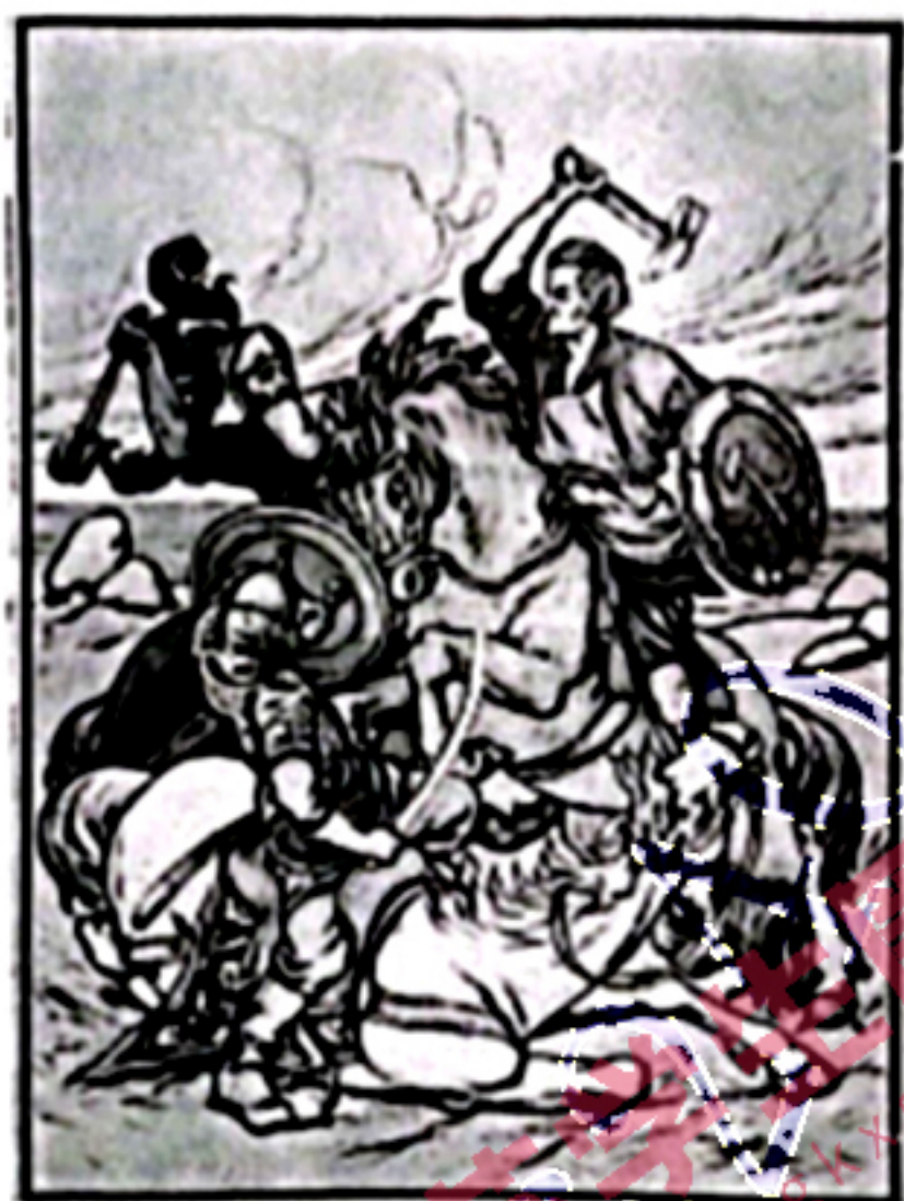
G.B. 兹沃雷金《红骑士与土地斗争》，1919年