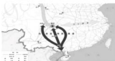
图1：西部陆海新通道空间布局示意图