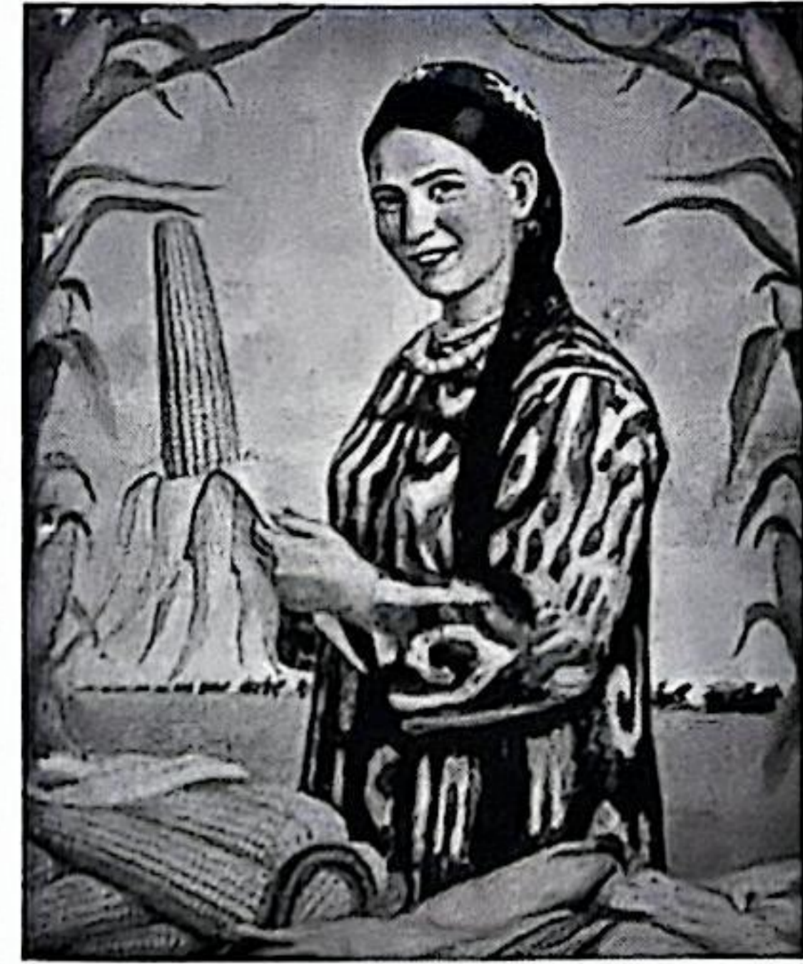
图4 《看,我们社里增加的财宝》(1957年)

根据材料并结合所学,从图像证史的角度赏析图片宣传画。(要求:表述成文,叙述完整,史论结合,逻辑严密。)