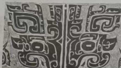
图 1 尊上饕餮纹(商)

1. 商代青铜器上的饕餮纹样繁缛华美，其身份趋向神，是商人祖先崇拜的符号；西周初年的饕餮纹样已基本发展出清晰的外轮廓，出现了具有典型动物特征的兽首饕餮，呈现世俗化特征。这一变化反映了