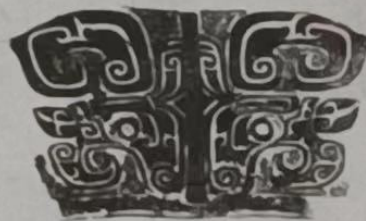
图 2 大盂鼎上饕餮纹(西周)