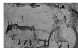
汉画像砖中的二牛抬杠