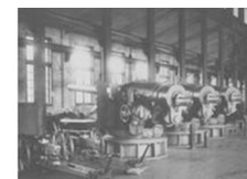
江南机器制造总局