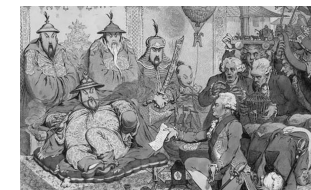
《在北京朝廷接见外交使团》(1792 年 9 月)

材料二 如图为英国漫画家詹姆斯·吉尔雷创作的表现“马嘎尔尼访华”的讽刺漫画:《在北京朝廷接见外交使团》。