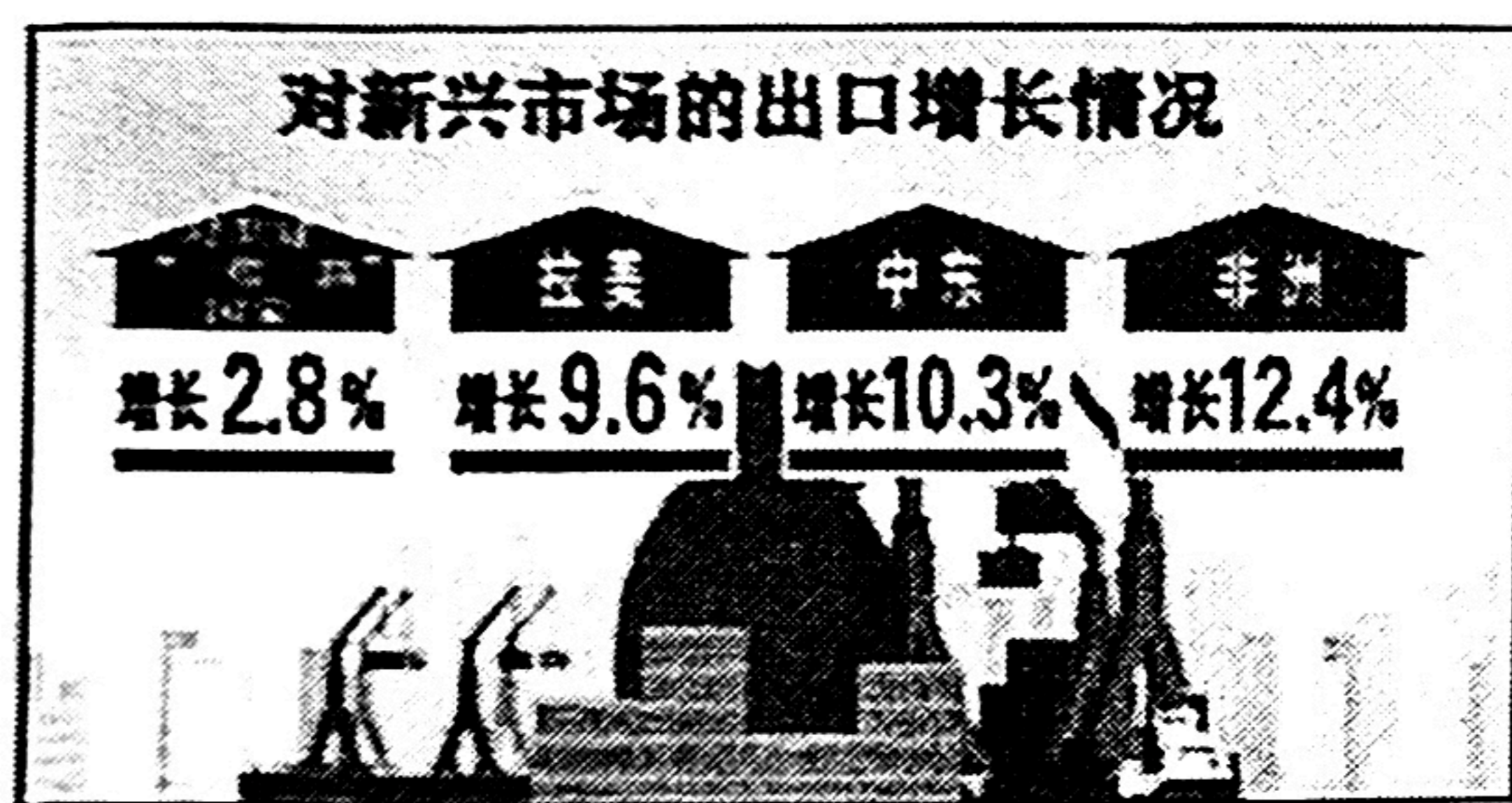
图1 广东省2023年前三季度对新兴市场的出口增长情况