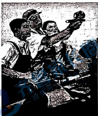
創造先進工作法·提高生產!