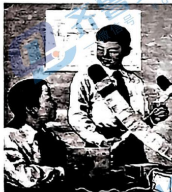
研究科學技術準備為祖國服務