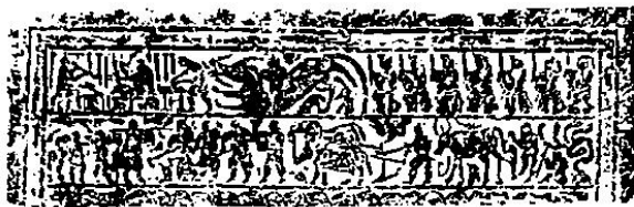
历史试题 第 1 页(共 8 页)