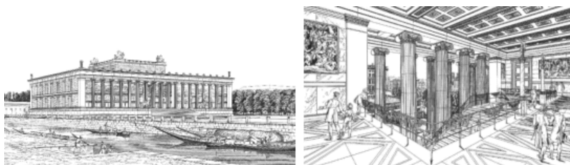
申克尔设计的博物馆及其二楼大厅透视图

18 世纪末的欧洲,博物馆向大众开放的呼声日益高涨。1822 年,普鲁士国王威廉三世将建设博物馆的大任交到申克尔的肩上。