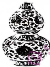
乙：明 青花缠枝莲纹葫芦瓶