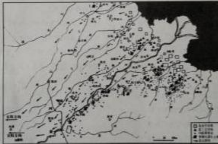
晚商时期食盐等内运示意图

围绕制盐作坊, 在靠近内陆的滨海平原上发现了数量相当的商王朝晚期聚落群。这些聚落居民种植粮食为盐工提供生活和生产物资, 并承担盐制品向内陆运输的任务。来自都城及周边地区的王室成员和官员、军队首脑, 居住和驻扎在高等级聚落和交通枢纽, 保卫和控制, 管理着盐业生产和食盐外运。