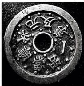
状元及第 一品当朝