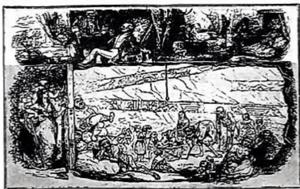
漫画《穷人国和富人国的写照》

材料一 下图为发表于1843年英国《笨拙》杂志的漫画《穷人国和富人国的写照》。该画还为资本家设计了一句道白:“尽管说煤窖里的境遇仍相当悲惨,但它也带来了许多奢华与享受,了解这一点也就可以让人欣慰了。”