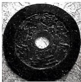
名登金榜 位列三台