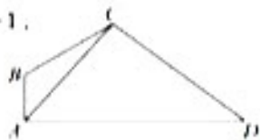
(第 17 题图)