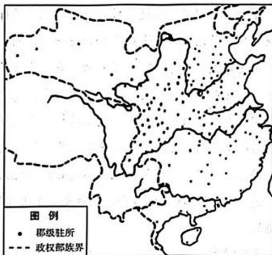
图4 隋代诸郡分布图