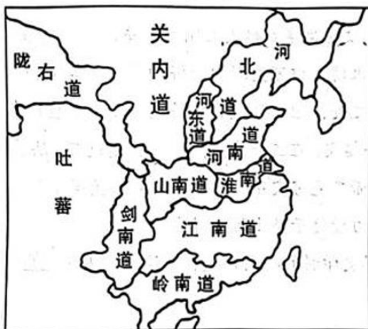
图5 唐代十道示意图