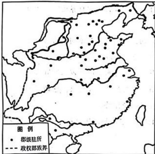
图3 秦代诸郡分布图