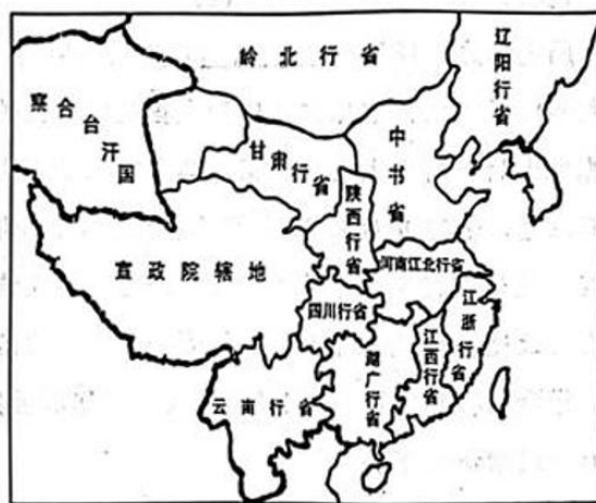
图6 元代十行省示意图