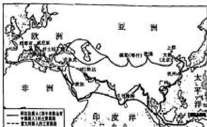
图5 14世纪欧亚贸易商路图