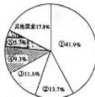
图3 世界主要国家工业产值的比重