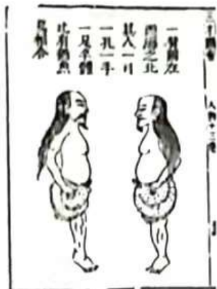
图1（选自明人所撰《三才图会》）