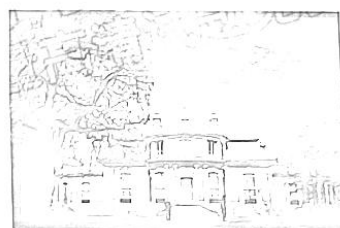
凡尔赛宫中的“中国宫”

如图:明朝后期,欧洲传教士利玛窦来华,向中国社会传播了西方的几何学、地理学知识等等,开了晚明士大夫学习西学的风气;清朝前期,在历法、制瓷和建筑风格等方面也借鉴了西方文化。而18世纪的欧洲却掀起一场“中国热”,中国的器物、建筑、园林被欧洲上流社会追捧,欧洲的学者、思想家对中国的科技、伦理、制度也表现出的巨大的兴趣、关注和研究。