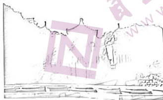
圆明园中的西式建筑