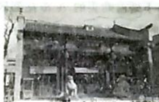
1954年，玉堂营镇进行了公私合营，成为山东省第一家公私合营的企业