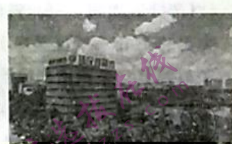
作为国家新区建设的缩影，济宁市高新区2021年综合考核列全省国家级高新区前五强