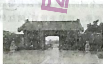
1926年，鲁西南地区第一个中国共产党支部在山东省立第二师范学校（位于曲阜）诞生

1. 寒假期间，济宁市某高中课题小组成员共享了他们所搜集到的一些代表性建筑图片资料。通过这些图片和文字，可以从中感悟到