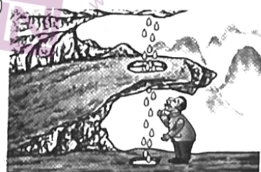
有些人感叹水滴的力量,却忽略了水滴的坚持