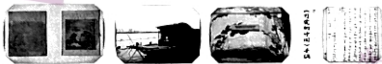
(《共产党宣言》中文译本) 南湖红船 “半条被子的温暖” 《可爱的中国》手稿

历史因铭记而永恒,精神因传承而不灭。党的十八大以来,习近平总书记到地方考察调研时,多次专程前往革命旧址、博物馆、纪念馆,瞻仰革命文物,倾听历史回响。