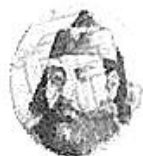
《江苏》中的黄帝画像

1903年11月的《江苏》，未经任何留存，从第3期(同年5月)起，就将其底页变为日期，从此前的“光绪二十九年”变更为“黄帝纪元四千二百九十四年”。第3期的封面，同时还登出了黄帝的写实画像。印有黄帝像的背面，更附有题词：“帝有五谷，抚育百姓，时维我祖，我祖是朕，亿兆子孙，皇祖成兹，我诸氏里，景祀皇之。”这幅相貌堂堂的黄帝像，似乎远比其他黄帝像更受当时中国人的青睐，不仅被选为《黄帝魂》(1903年11月)、《国粹学报》(第3期，1903年4月)等所复制及转载，更被原样采用于中国同盟会的机关报《民报》的创刊号(1905年11月)。