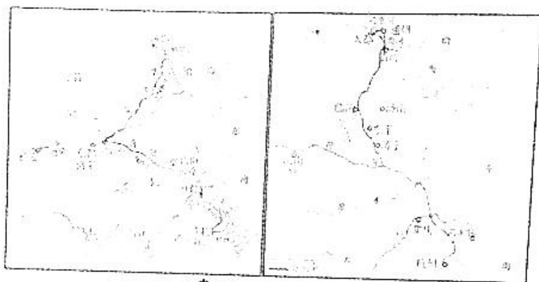
图 4 隋 图 5 元