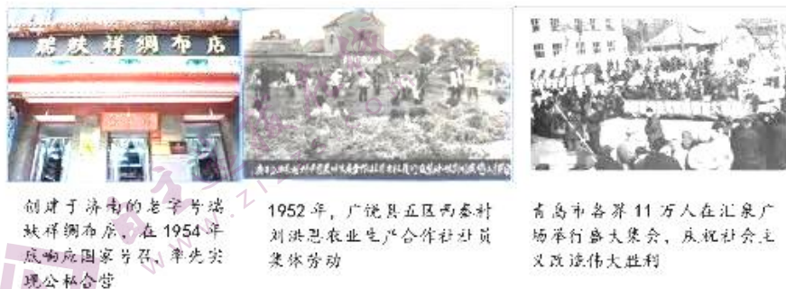
创建于济南的老字号大祥绸布店，在 1954 年底响应国家号召，率先实现公私合营

19. 某班组织学生开展研究性学习，确定的主题是“新中国峥嵘岁月——社会主义改造”。围绕这一主题同学们共享了一组图片。通过这些图片和所学知识，可以感悟到（ ）