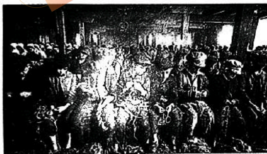
图5 电影《雾都孤儿》剧照

材料二 图5、图6是近现代两部电影中的场景。图5是电影《雾都孤儿》(1922年)剧照，同名小说1838年出版，图片所示为奥利弗等童工在拆麻绳；图6是秀兰·邓波儿主演的电影《卷头发》(1935年)剧照，图片所示为美国孤儿院的午餐时刻。