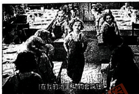
图6 电影《卷头发》剧照

(1) 据材料一，概括说明15世纪以来“儿童逐渐被发现”的表现，并结合所学知识分析其原因。(6分)