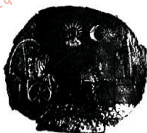
图2 阿伊哈努姆出土的二神驾车图像饰板