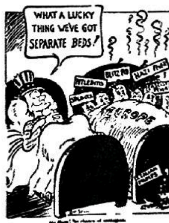
图 3 《不会被传染!》