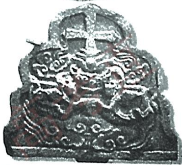
图2 景教尖拱形飞天石刻