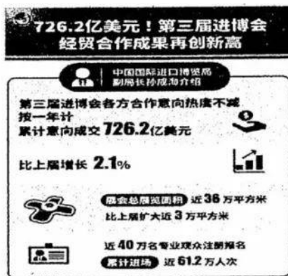
图2:第三届进博会成果