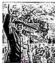
图一 完成一九五三年计划

10. 新中国成立初期,老一辈艺术家们曾创造出许多优秀的宣传类年画。右图这一年画反映了