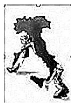
注:左边的护士身穿红、白、绿三色的衣服;右边的护士身穿红衣,上面点缀了五颗黄色的五角星

16. 2020 年,全球疫情蔓延,右图是一名意大利女生画的相关漫画。漫画反映了