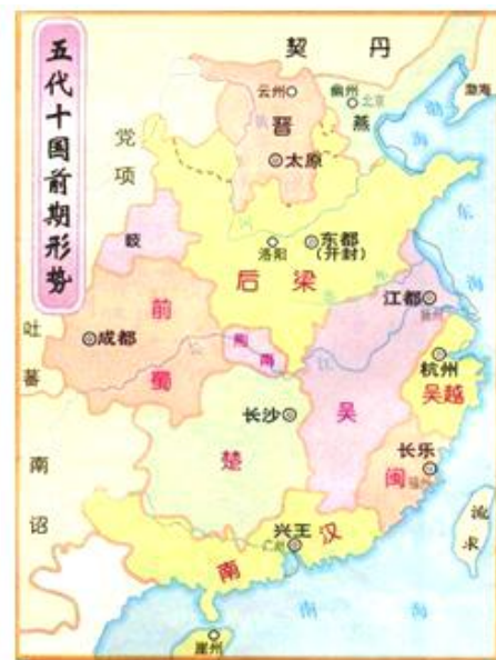
图2 五代十国前期形势图（910年）