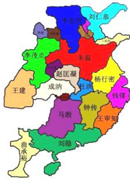
图1 唐末藩镇割据形势图（902年）