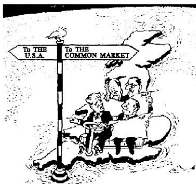
《开往美国,还是通向共同市场》(1960年)