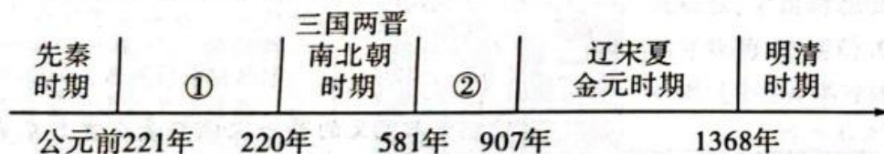
A. 统一多民族国家的建立和巩固