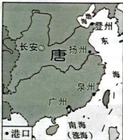
图A 唐朝前期对外贸易港口分布图