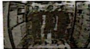
三名航天员进入天和核心舱