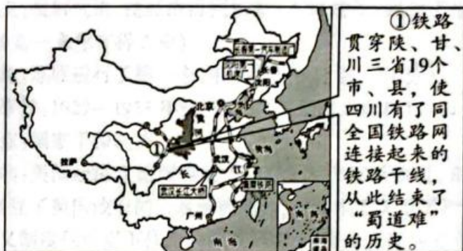
图C 第一个五年计划期间工业交通建设主要成就分布示意图