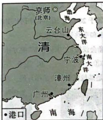
图B 清朝前期对外贸易港口分布图

(1) 材料一图A和图B中共同的对外贸易港口是_____;(1分)北宋前期,四川地区出现_____,这是世界上最早的纸币;(1分)14世纪初,中国四大发明中的_____传入欧洲后,对欧洲的火器制造和作战方式产生巨大影响,推动了欧洲社会的变革;(1分)_____人担当了沟通东西方文化的角色,中国许多重大发明都是由他们传入欧洲的。(1分)