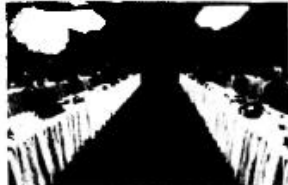
“你们没有资格居高临下同中国说话”