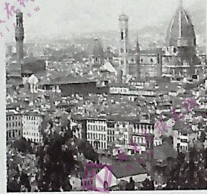
图2 佛罗伦萨历史中心