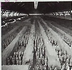
图5 秦始皇陵及兵马俑坑