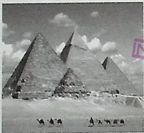
图1 孟菲斯及其墓地金字塔

材料 世界遗产往往是一个国家或者一个地区人文知识和自然知识的代表,以其资源的高价值、不可再生等特性在旅游业中独树一帜。在旅游业蓬勃发展的当今世界,世界遗产旅游也将以其独一无二的遗产资源吸引更多的旅游者,成为旅游的新热点。下面是一些国内外著名的世界遗产(或非物质文化遗产):