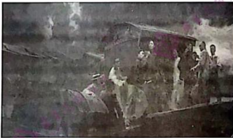
油画《启航——中共一大会议》 作者:何红舟 黄发祥

学史明理,学史增信,学史崇德,学史力行。为了激励全党全国各族人民满怀信心迈进全面建设社会主义现代化国家新征程,中共中央决定在全党开展党史学习教育。