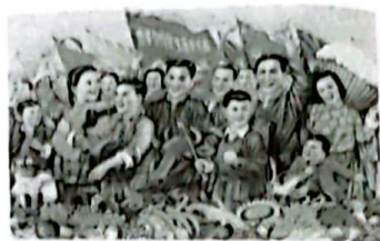
图二：农业合作化生产步步高