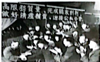
图一：资本主义工商业迎接公私合营