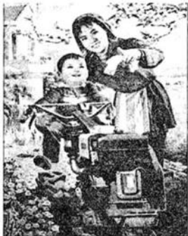
图3《我家买了大金牛（拖拉机）》（1985年，汪苗作）

大约在1985年前后，我们老家几乎每个庄上都已经有了私人拖拉机，做为改变传统农耕方式的先行者活跃在田间地头。能拉麦能打场，农闲时还能跑短途运输或搞个体加工，都能挣来大团结。1988年春，我家也从县城买回一辆手扶拖拉机，是郑州第二拖拉机厂出产的红卫12匹。样式就和宣传画《我家买了个大金牛》中的拖拉机一样。拖拉机买回来后，不到半年时间，我家又配套了除了收割机之外齐全的农具。此后，农户个人购买小型拖拉机的热情异常高涨，不少农民持币待购。大中型拖拉机市场需求下降之后，洛阳第一拖拉机厂等一批大中型拖拉机厂也兼产和转产小型拖拉机。再后来，小四轮拖拉机日益进入农家，甚至有些地方出现顺口溜“家有小四轮，媳妇才进门”。