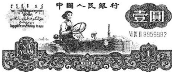
图2 1962年版第三套1元面值人民币上的“东方红”拖拉机

1962年版第三套人民币的壹元面值纸币上那个英姿飒爽的女拖拉机手原型人物是梁军，而她驾驶的拖拉机就是“东方红”拖拉机。1947年，17岁的梁军进入中国共产党人创办的乡村师范学校就读。在校期间，梁军积极报名参加拖拉机培训班，她驾驶着从苏联进口的拖拉机成为中国第一个女拖拉机手。50年代中期，随着农业社会主义改造的顺利进行，国家也开始大规模、有组织地开发北大荒。梁军也成为了北大荒建设队伍中的一员。1959年11月，洛阳第一拖拉机厂刚刚投产，就向北大荒国营农场运送了第一批13台“东方红”大型拖拉机。黑龙江省政府找到梁军，希望中国第一个女拖拉机手开第一台中国制造的拖拉机。