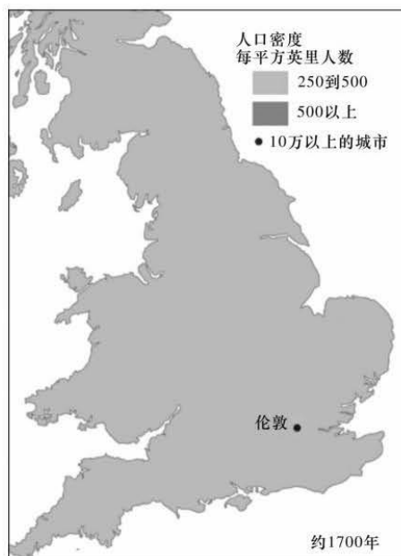
约 1700 年