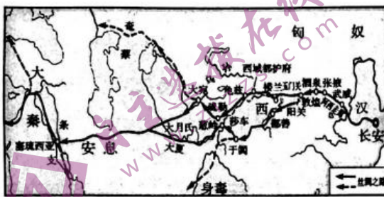
汉代丝绸之路示意图

10. 下面为汉代丝绸之路和元代丝绸之路示意图。与汉代相比,元代丝绸之路的主要不同是