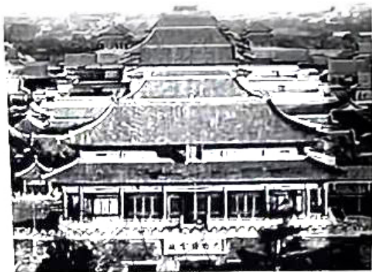
图1 紫禁城中轴线建筑群北视图

北京故宫旧称紫禁城, 是我国古代宫殿建筑的优秀代表, 而位于中轴线区域的建筑群(见图1)则是其中的精华