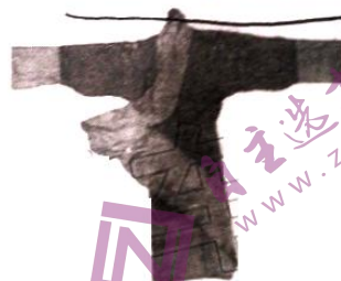
长沙马王堆一号汉墓出土的直裾深衣和曲裾深衣

除了这种长衣之外,汉代也穿短衣,常见的是襦。襦的长度通常至腰部,穿时下身配裙。汉时劳动女子总是上穿短襦,下穿长裙,膝上装饰长长垂下的腰带。劳动男子常服是上身穿襦,下身穿犊鼻裤,并在衣外围罩布裙;这种装束不分工奴、农奴、商贾、士人,都一样。大约到东汉以后,人们开始在襦上纺织各种图案纹样。